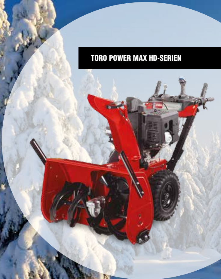
TORO POWER MAX HD-SERIEN