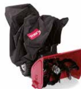
Trekk til 2-trinn snøfres