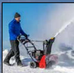
1- OG 2-TRINNS SNØFRESERE