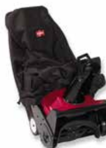
Trekk til 1-trinn snøfres