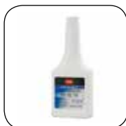
Toro snøfreser olje