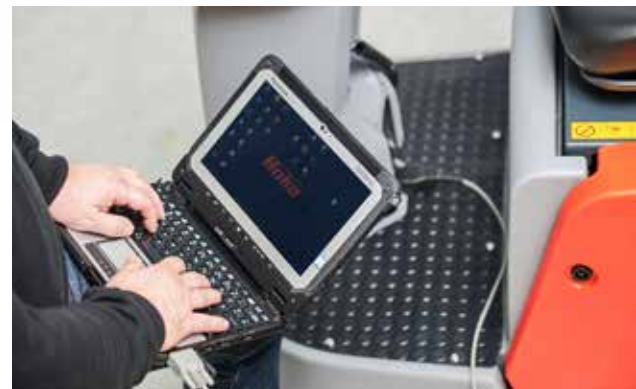
Enkel åtkomst till diagnostiksystemet för underhållsarbete och modifiering av maskinställningar.

Hako Ground & Garden AB Skallebackavägen 10 302 41 Halmstad Tel: 035-10 00 00 www.hako.se